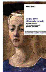
★ La più bella pittura del mondo , di Attilio Brilli, Aboca 2021, 264 pagine, 35 €. Formato: 15x22,5 cm

La pittura di Piero della Francesca (1416/17-1492) è stata, ed è, ambito di studi tra i più frequentati dagli storici dell'arte, ma le opere del maestro aretino ricorrono con straordinaria frequenza anche nelle riflessioni di poeti, filosofi, artisti, narratori e scienziati che hanno avuto modo di "incontrarle". Attilio Brilli, scrittore e docente universitario, tra i massimi studiosi della letteratura di viaggio, mette a fuoco questo fenomeno in un arco temporale che dall'inizio dell'800 arriva ai nostri giorni. L'orizzonte geografico è l'itinerario che tocca i punti cardinali della pittura di Piero: Arezzo con gli affreschi della Leggenda della Vera Croce in San Francesco; Sansepolcro (il borgo di origine dell'artista) con le opere nel Museo Civico (sopra a tutte la Resurrezione ); Monterchi con la Madonna del Parto ; Rimini con l'affresco nel tempio Malatestiano; Urbino con la Flagellazione e la Madonna di Senigallia . Luoghi vissuti da tanti colti viaggiatori come tappe di un percorso in cui il confronto con le opere ha ispirato «non comuni occasioni narrative».